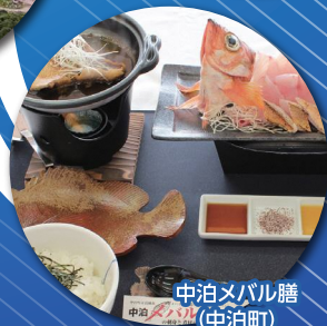
中泊メバル膳 (中泊町)