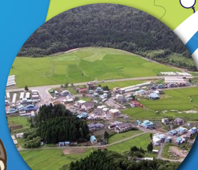
大平山元遺跡 (外ヶ浜町)