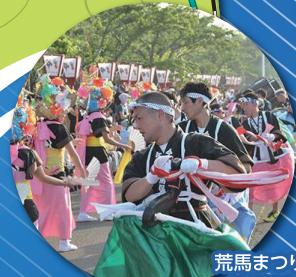
荒馬まつり (今別町)